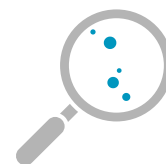
ANALYSES DES PARTICULES